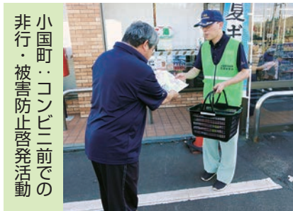
小国町：コンビニ前での非行・被害防止啓発活動