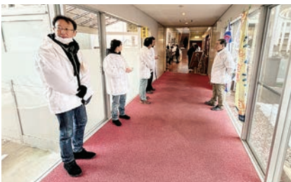
白鷹町：イベント会場での啓発活動