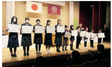
米沢市：青少年育成市民大会での表彰