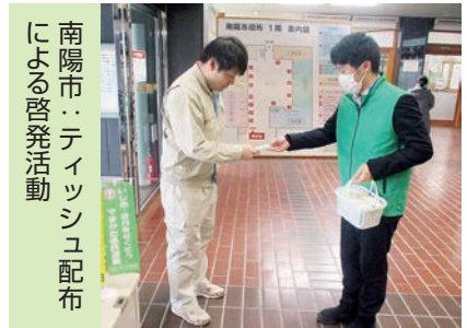
南陽市：ティッシュ配布による啓発活動