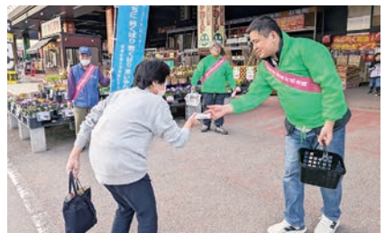
高畠町：街頭での啓発活動