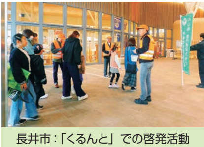
長井市：「くるんと」での啓発活動