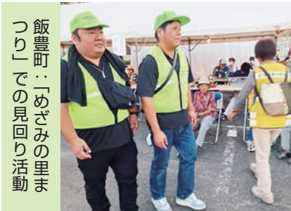
飯豊町：「めざみの里まつり」での見回り活動