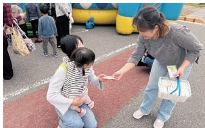
川西町：イベント会場での啓発活動